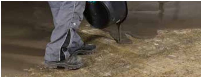
4 Direkt nach dem Anmischen in gewünschter Schichtdicke verteilen