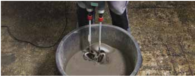
3 Mit geeignetem Rührwerk mindestens drei Minuten intensiv mischen