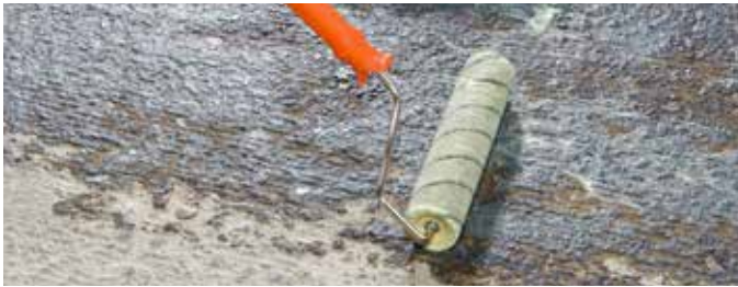
2 Grundierung mit KÖSTER SL Primer