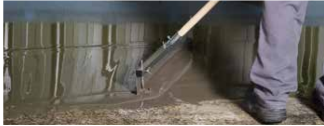
5 Auf größeren Flächen wird die Bodenausgleichsmasse mit einem Zahnrakel verteilt